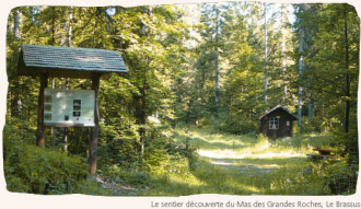
Le Sentier (découverte du Mas des Grandes Roches, Le Brassus)

Les sentiers de découverte Naturland Casseur de 34 balades thématiques illustrées, dont 19 situées dans le Parc Jura vaudois. Renseignements: www.parcjura-vaudois.ch (jous: documentation / ouvrages en vente) ou www.naturando.ch