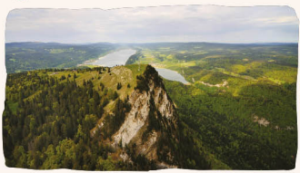
La Dent de Vaillon

R1 La Grande Traversée à pied, de St-Cergue à Romaniinôtier (45 km, 3 jours; variante de 2 jours) Découvrez les crêtes du Jura avec leurs somptueux panoramas et les pâturages boisés. Après avoir franchi le Mont Tendre (1679 m), l'itinéraire continue par le Pied du Jura et ses villages authentiques. Bons de réduction dans les brochures du parc.