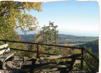
La Roche du Gid, Saint-Georges