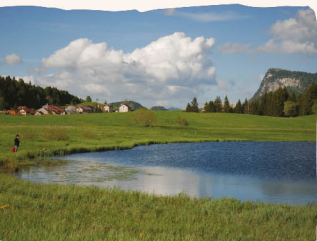
Lac Joux, Le Sébéty

plantes plutôt que les plantes elles-mêmes • ramasser vos déchets • refermer derrière vous les portails et vous montrer prudents en présence de vaches accompagnées de leurs veaux • garder en tout temps la maîtrise sur votre chien