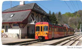
Gare de St-Cergue

Plusieurs lignes de transport public (CarPostal, AVJ, Travs, M&C, NS&M et CFF) assurent l'accès et les déplacements confortables dans le Parc Jura vaudois. Vous pouvez trouver les correspondances sur www.cff.ch . Pour les lignes estivales de bus pour les Col du Marchairiaz et Col du Mollendruz: www.baudat.ch